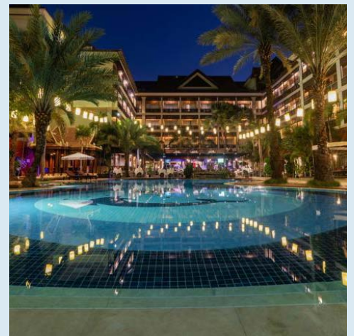
悦游升級入住暹粒豪華 5 星 Empress Angkor Resort & Spa