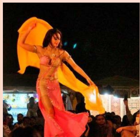
【篝火晚宴欣赏肚皮舞】