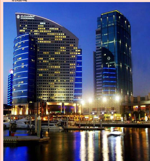
【白金 5 星迪拜洲際酒店】 InterContinental Dubai Festival City

导游在接团过程中可根据实际情况合理地调整行程内容的先后。我社保留因汇率波动，接待价格波动而调整价格的权利，并不需提前通知。