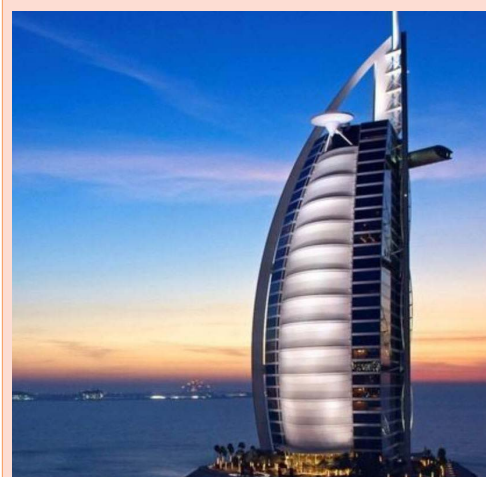
【帆船酒店内自助午餐】