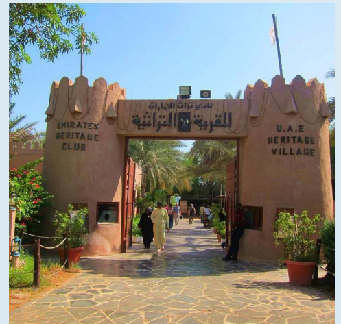
【Heritage Village 民俗村】