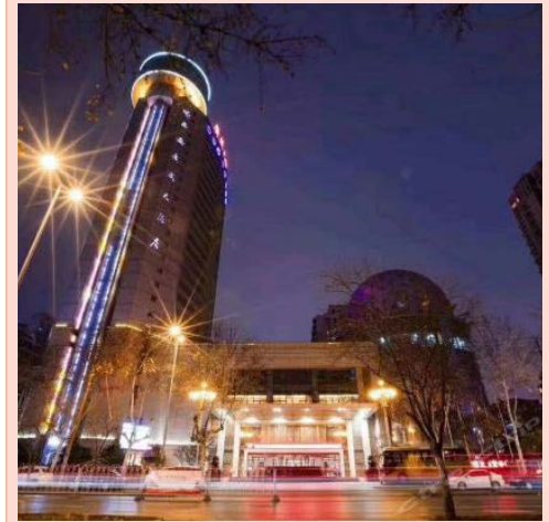
【西安 5 星廣成酒店】