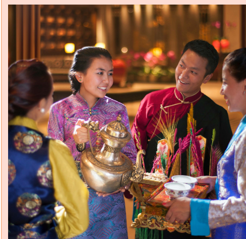
【超 5 星香格裏拉酒店】 www.shangri-la.com